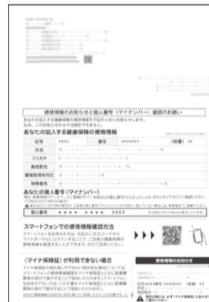
同封の「資格情報のお知らせ」

同封の「資格情報のお知らせ」に記載されている個人番号(マイナンバー)下4桁の数字が、あなたの個人番号(マイナンバー)の下4桁と一致しているか、ご確認をお願いいたします。