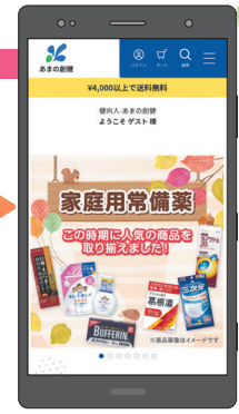
ゲストユーザーでログイン完了