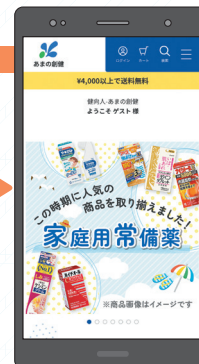
ゲストユーザーでログイン完了