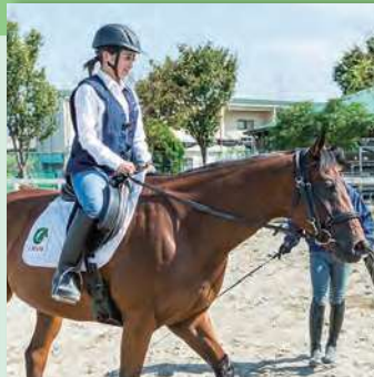
3 馬の操作を試してみよう!