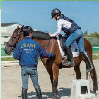
2 馬に乗ってみよう!